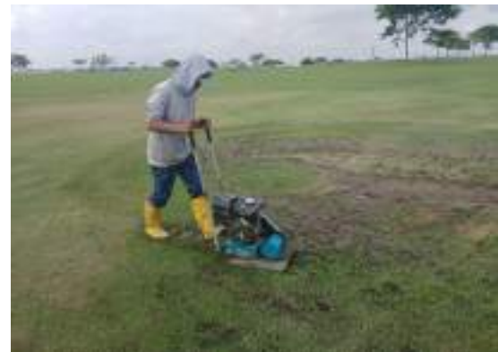
Actividad: Limpieza y drenaje en fairway del hoyo 13 Duración: 16, 17, 18, 19 y 20 de marzo