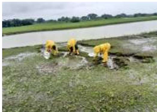
Actividad: Retiro de maleza manual en el vivero Duración: 11 y 12 de marzo