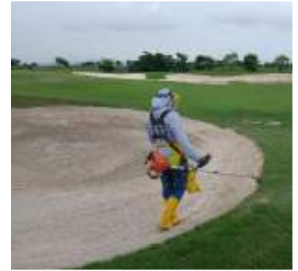
Actividad: Mantenimiento en bunkers Duración: 16, 17, 18, 19 y 20 de marzo