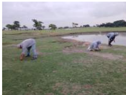
Actividad: Retiro de maleza manual en el vivero del campo de práctica Duración: 27 de marzo