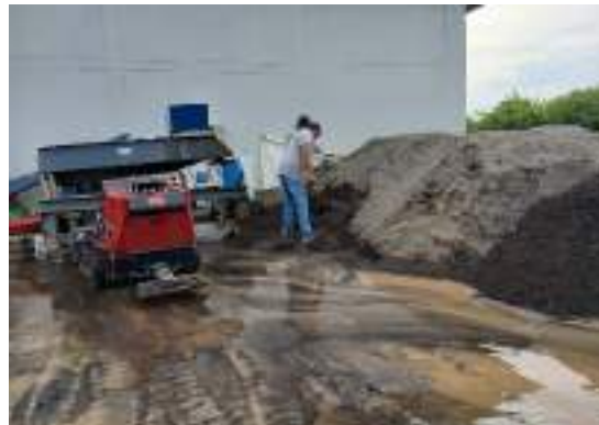
Actividad: Tamizando arena Duración: 16 y 17 de marzo