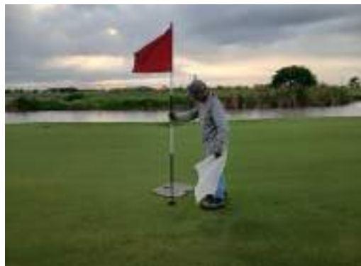
Actividad: Cambio de banderas Duración: 25 de marzo