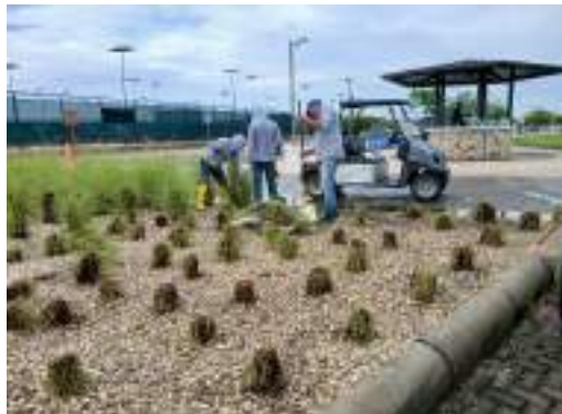
Actividad: Poda de pennisetum Duración: 10 de marzo