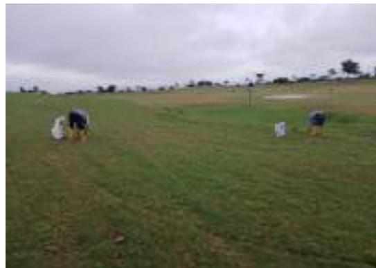
Actividad: Retiro de maleza manual en campo de práctica