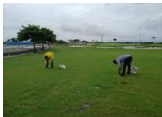
Actividad: Retiro de maleza manual en hoyo 11 Duración: 12 de marzo