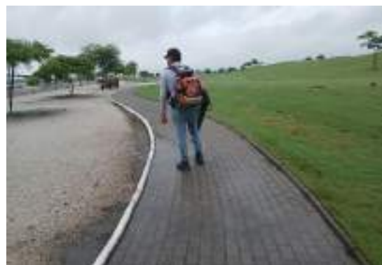
Actividad: Aseo de car paths Duración: 06 de marzo