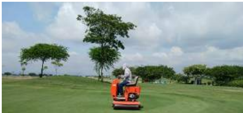
Actividad: Roller en greens después de la aireación con tines solidos Duración: 02 de marzo