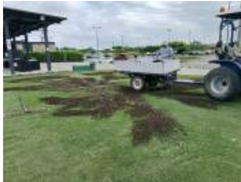
Actividad: Top dressing en el campo de práctica Duración: 16 de marzo