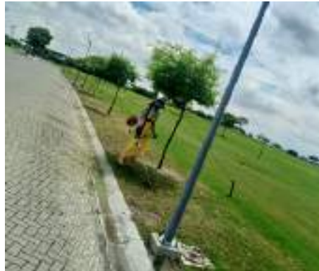
Actividad: Desbrozadora en los orillos de los árboles Duración: 11 y 12 de marzo