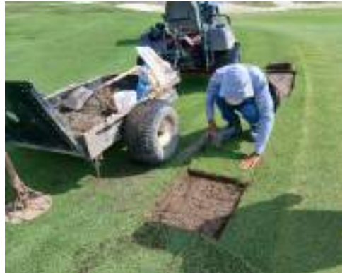
Actividad: Siembra parche en el antegreen del hoyo 2 Duración: 17 y 18 de marzo