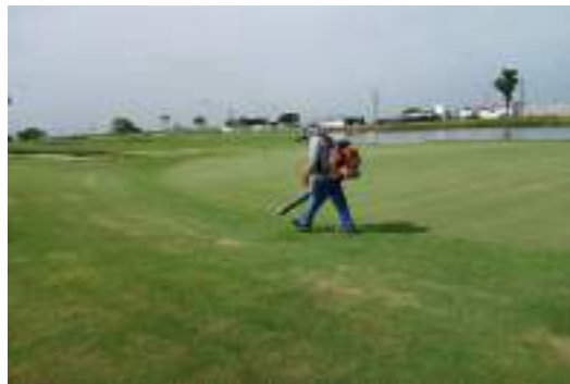
Actividad: Sopladora alrededor de greens Duración: 17, 18 y 19 de marzo