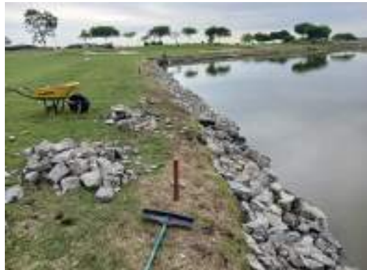
Actividad: Enrocado en el filo del lago 17 Duración: 25, 26 y 27 de marzo