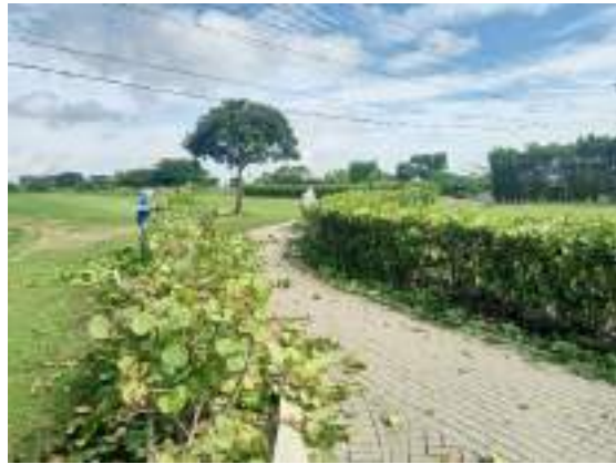
Actividad: Poda de cocoloba en hoyo 8 y 9 Duración: 04 y 05 de marzo