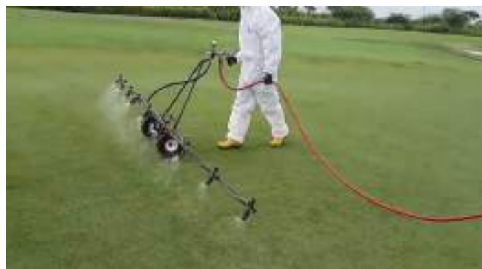
Actividad: Aplicación de insecticida en greens Duración: 17 de marzo