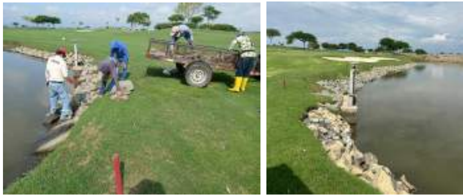
Actividad: Enrocado en el lago del hoyo 17 Duración: 02, 03, 04, 05 y 06 de marzo