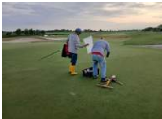
Actividad: Cambio de banderas Duración: 18 de marzo