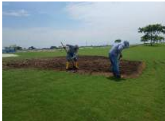
Actividad: Conformación para siembra en estolones Duración: 05 de marzo