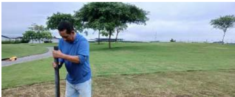
Actividad: Nivelación en el sitio donde se encontraban las bancas en salidas de tee Duración: 03 de marzo