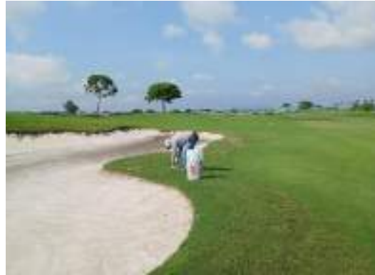
Actividad: Retiro de maleza manual en el antegreen del hoyo 13 Duración: 02 y 03 de marzo