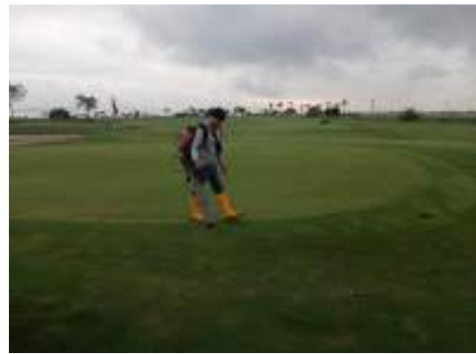
Actividad: Sopladora alrededor de greens Duración: 02, 03, 04, 05 y 06 de marzo