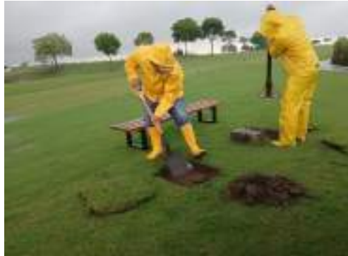
Actividad: Instalación de bancas en las salidas de tee entre la 65 y 60 Duración: 04 de marzo