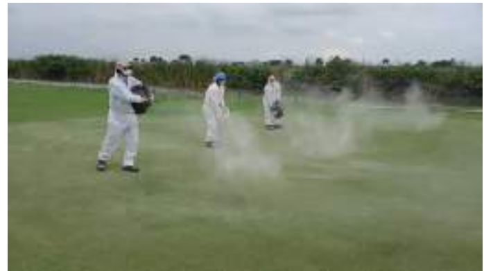
Actividad: Aplicación de cal agrícola a los greens Duración: 16 de marzo