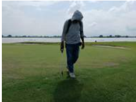
Actividad: Control de insecticida en greens del hoyo 9 y 18 Duración: 19 de marzo