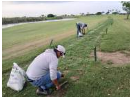
Actividad: Retiro de maleza manual en zonas plantadas Duración: 25 de marzo