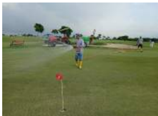
Actividad: Fertilización en greens Duración: 23 y 26 de marzo