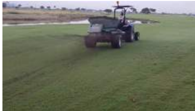
Actividad: Topdressing en hoyo 17 Duración: 16 de marzo