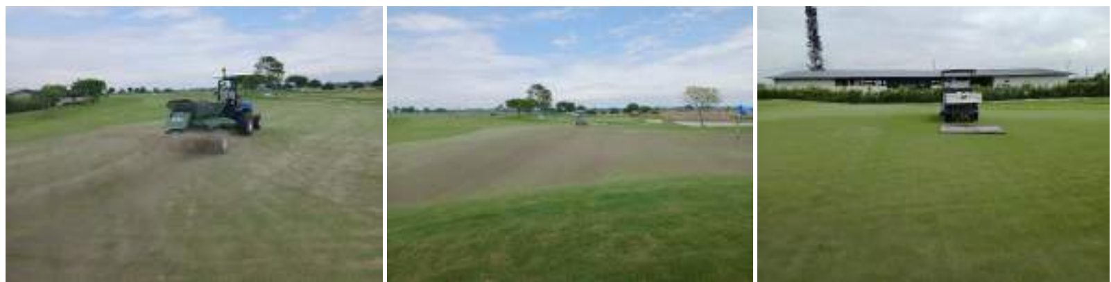
Actividad: Topdressing en el green del hoyo 10 Duración: 05 de marzo