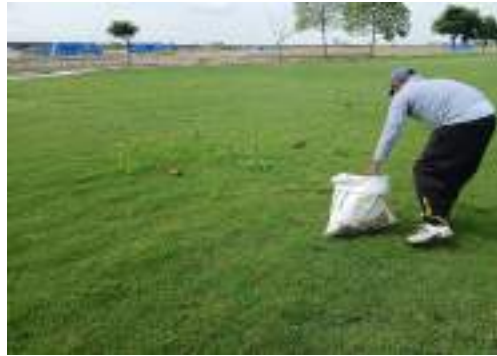
Actividad: Retiro de maleza en el campo Duración: 16 y 19 de marzo