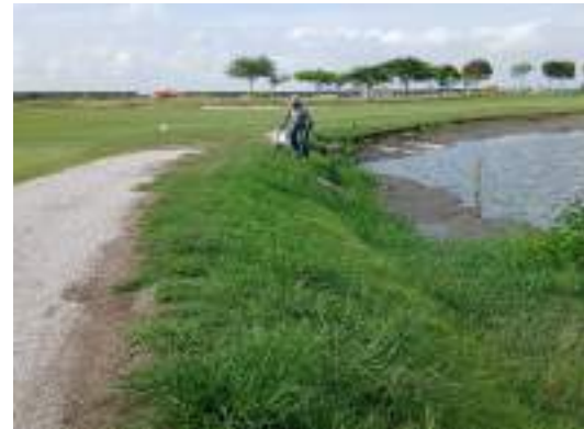
Actividad: Mantenimiento en el filo de los lagos Duración: 19 y 20 de marzo