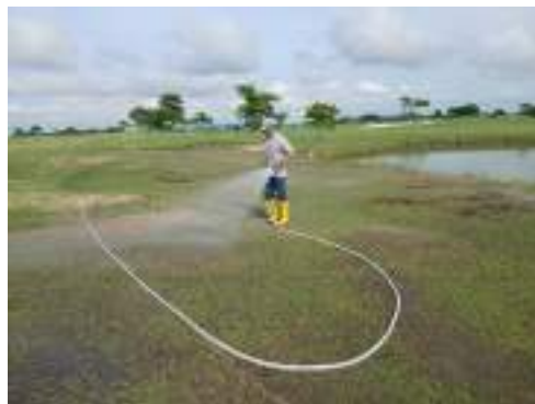
Actividad: Fertilización en vivero campo de práctica Duración: 18 de marzo