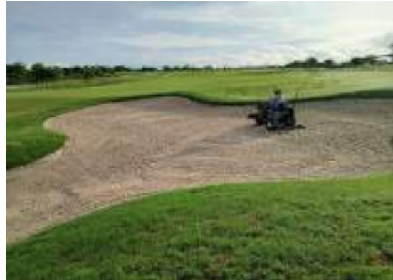
Actividad: Mantenimiento en los bunkers Duración: 02, 03, 04, 05 y 06 de marzo