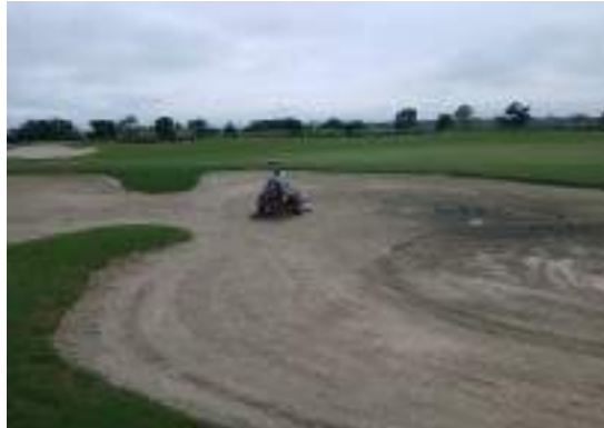
Actividad: Mantenimiento en bunkers