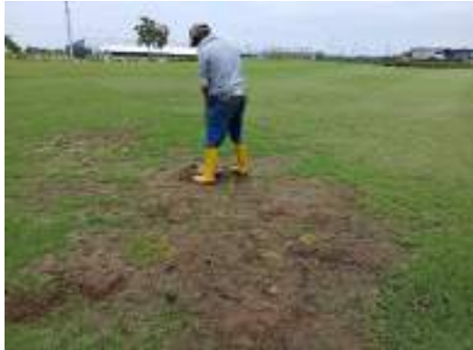
Actividad: Siembra de estolones en zonas escarpadas en el fairways del hoyo 10 Duración: 10 de marzo