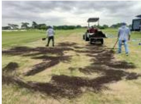
Actividad: Top dressing en el campo de práctica Duración: 23 de marzo