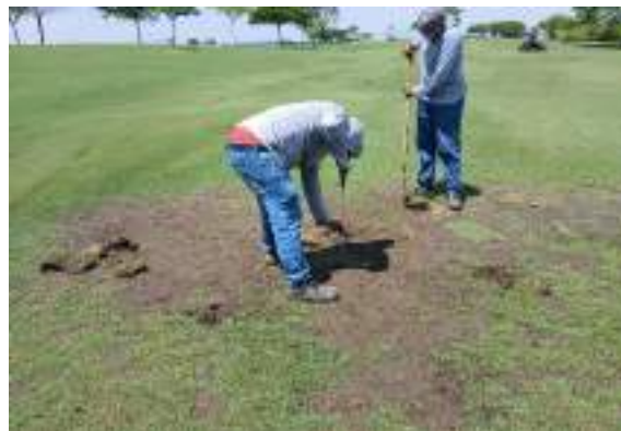
Actividad: Resiembra de estolones en zonas del fairways hoyo 10 Duración: 05 de marzo