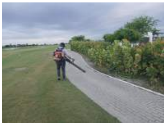
Actividad: Limpieza de car paths Duración: 19 de marzo