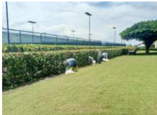
Actividad: Limpieza de cocoloba Duración: 11 de marzo