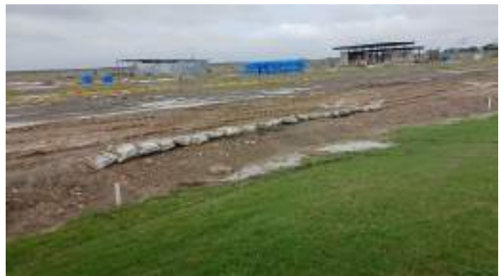
Actividad: Colocación de barreras de sacos en el perímetro del hoyo 15