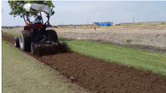
Actividad: Trabajos con rotavito en las zonas de tránsito de carritos de golf Duración: 24 de marzo