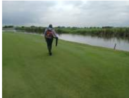
Actividad: Sopladora alrededor de los greens Duración: 25, 26 y 27 de marzo