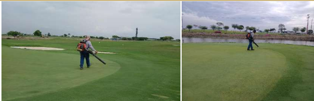
Actividad: Sopladora alrededor de greens Duración: 19, 20, 21, 22 y 23 de enero