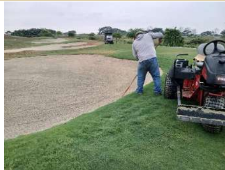
Actividad: Trabajos en bunkers Duración: 5, 6, 7, 8 y 9 de enero