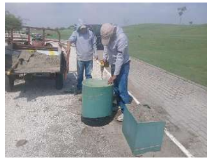
Actividad: Relleno de arena y recolección de basura de los tachos Duración: 16 de enero