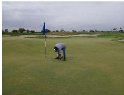
Actividad: Cambio de hoyos Duración: 7, 10 y 11 de enero