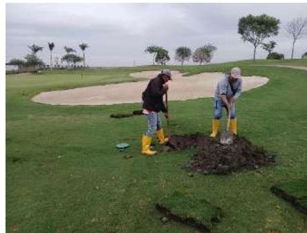
Actividad: Arreglo del sistema de hidráulico en la entrada del antegreen del hoyo 2 Duración: 21 de enero