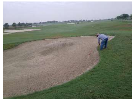
Actividad: Trabajos en bunkers Duración: 12,13, 14, 15 y 16 de enero