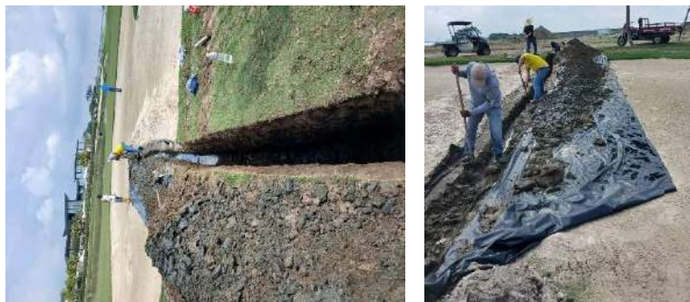
Actividad: Arreglo del sistema de hidráulico en la entrada del antegreen del hoyo 2 Duración: 21 de enero