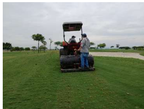
Actividad: Trabajos de aireación en la segunda vuelta Duración: 19, 20 y 21 de enero