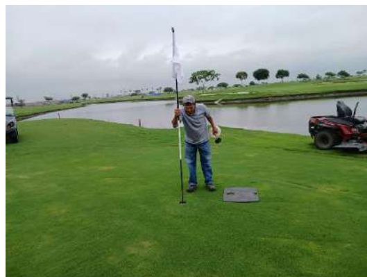
Actividad: Cambio de hoyos provisionales Duración: 27 y 30 de enero