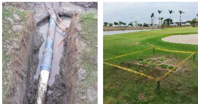
Actividad: Arreglo de tubería del sistema hidráulico de riego en hoyo 2 Duración: 22 de enero