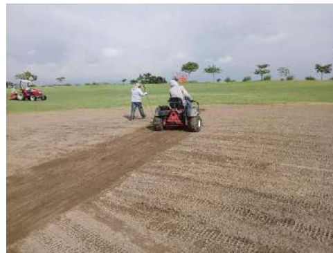
Actividad: Trabajos de nivelación en terreno en zona del hoyo 11 Duración: 19 y 20 de enero