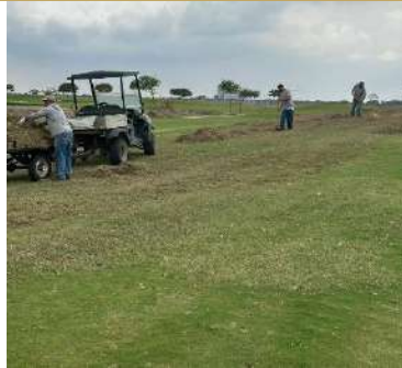
Actividad: Limpieza luego de prueba del equipo Thatch Máster Duración: 23 de enero