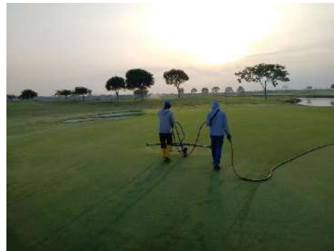
Actividad: Aplicación integral de plagas en greens Duración: 19 y 20 de enero