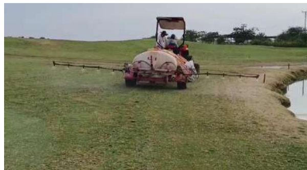
Actividad: Aplicación de yeso agrícola en hoyo 2 hasta el 7 Duración: 6, 7 y 8 de enero