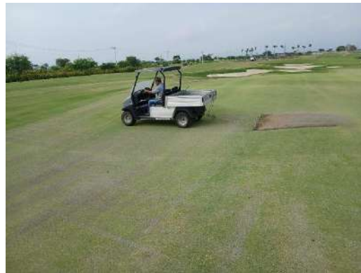
Actividad: Pasada de malla en greens Duración: 27, 28, 29 y 30 de enero