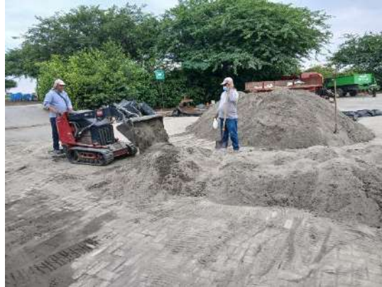
Actividad: Preparación de arena con fungicida y acaricida para topdressing Duración: 26, 27, 28 y 29 de enero