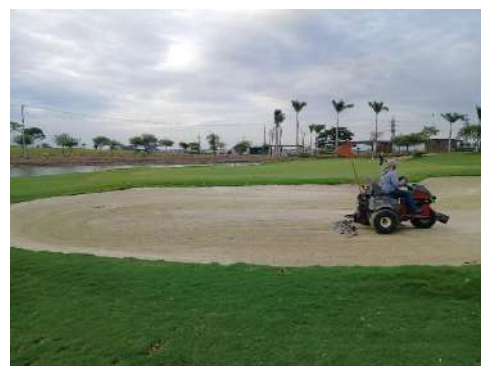
Actividad: Trabajos en bunkers Duración: 19, 20, 21, 22 y 23 de enero