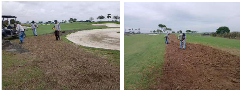
Actividad: Trabajos en zonas donde transitan carritos de golf Duración: 20, 21, 22 y 23 de enero