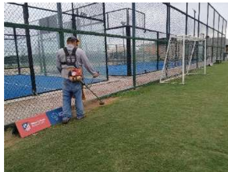
Actividad: Trabajos de mantenimientos en cancha de futbol, piscina y prado Duración: 5, 7 y 9 de enero