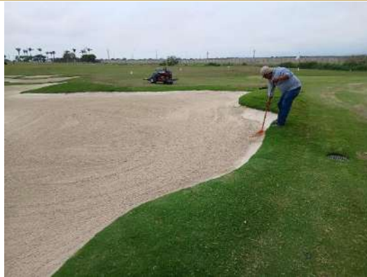
Actividad: Mantenimiento en bunkers Duración: 29 y 30 de enero