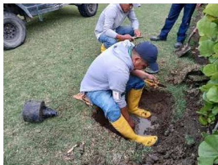
Actividad: Arreglo del sistema de riego en el área del Prado Duración: 6 de enero