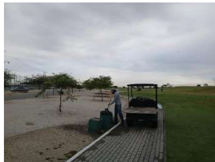
Actividad: Aseo y relleno de arena en los tachos Duración: 7 de enero