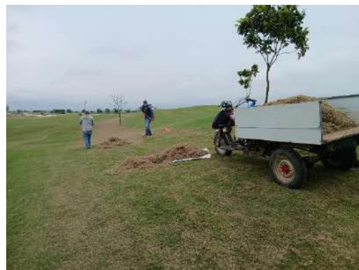
Actividad: Recogida del verticut Duración: 29 y 30 de enero