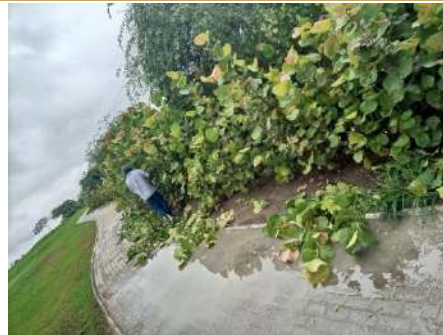
Actividad: Poda de cocolobas en el campo de golf Duración: 15 y 16 de enero