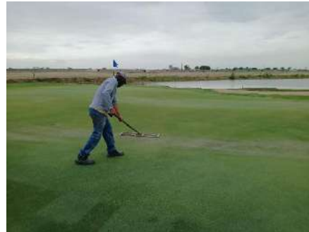
Actividad: Nivelación de arena en áreas con asentamientos en los greens Duración: 7 de enero