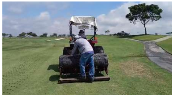
Actividad: Trabajos de aireación en la segunda vuelta Duración: 12, 13, 14, 15 y 16 de enero