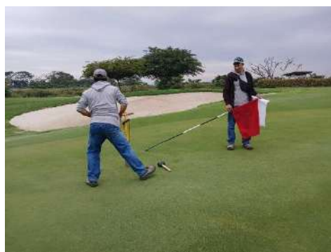
Actividad: Cambio de hoyos Duración: 21, 24 y 25 de enero