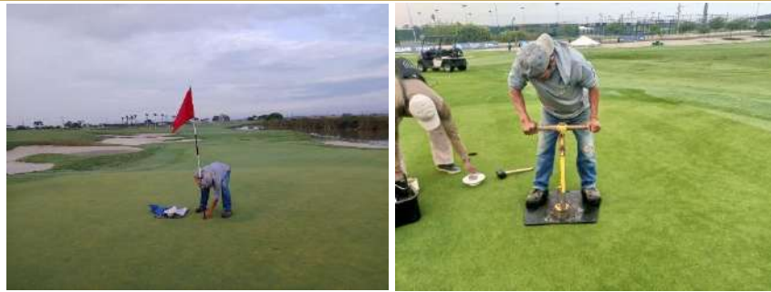
Actividad: Cambio de hoyos Duración: 14, 17 y 18 de enero