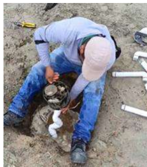
Actividad: Arreglo del sistema hidráulico en hoyo 11 Duración: 20 de enero