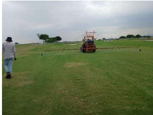
Actividad: Aplicación de control de maleza en campo de golf Duración: 26 de enero