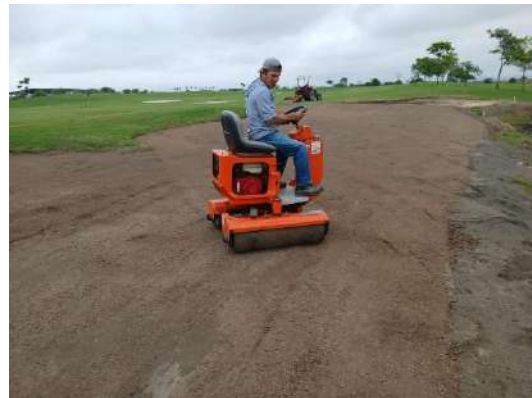
Actividad: Siembra de vivero Duración: 28 y 29 de enero