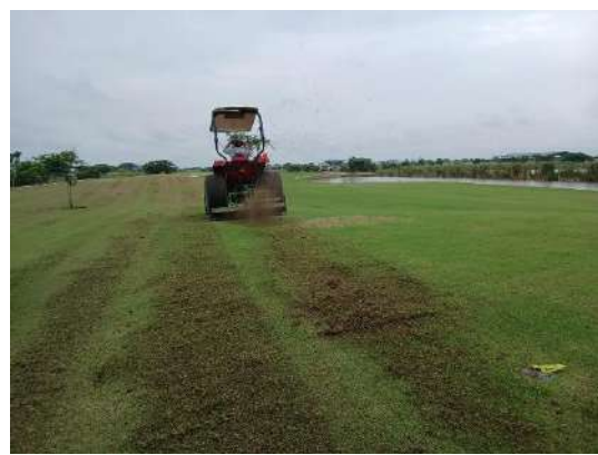
Actividad: Verticut en el campo Duración: 26, 27 y 28 de enero