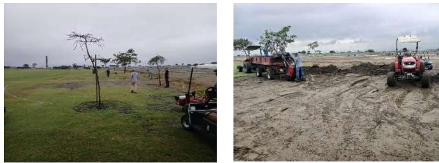
Actividad: Arreglo de sumidero en hoyo 11 Duración: 12, 13, 14, 15 y 16 de enero