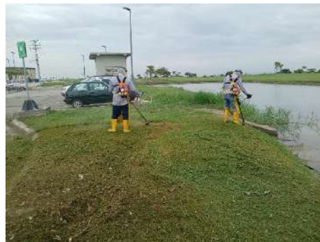
Actividad: Desbrozadora en los fillos de los lagos Duración: 22 de enero