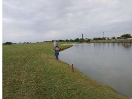
Actividad: Trabajos en los filos de los lagos Duración: 5,6 y 7 de enero