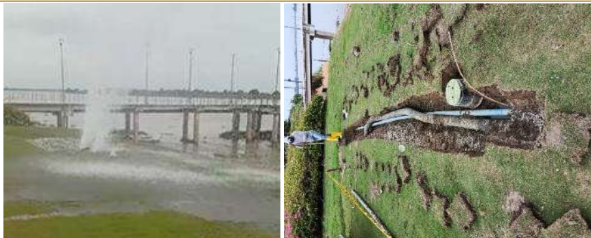
Actividad: Arreglo de tubería del sistema hidráulico de riego en hoyo 9 Duración: 21 y 22 de enero