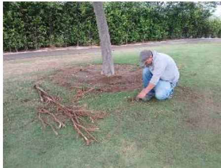
Actividad: Extracción de raíces en el antegreen del hoyo 13 Duración: 9 de enero