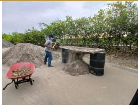
Actividad: Mezcla de arena con abono orgánico (Biocompost) Duración: 8 y 9 de enero