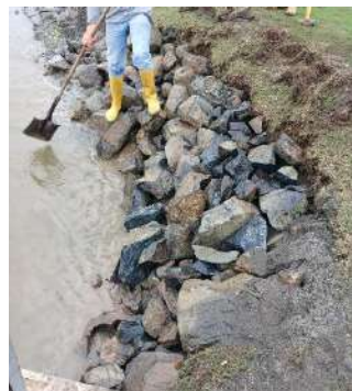
Actividad: Arreglo de talud en el lago del hoyo 17 Duración: 15 y 16 de enero