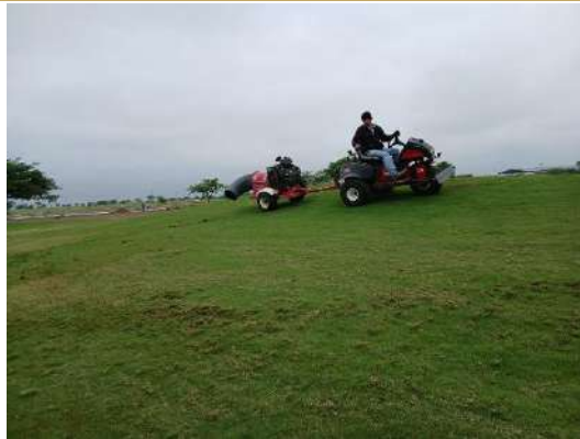
Actividad: Turbina en campo Duración: 26, 27, 28, 29 y 30 de enero