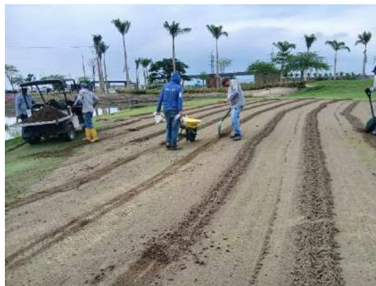
Actividad: Aireación en greens y antegreens Duración: 26 y 27 de enero