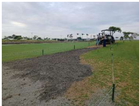
Actividad: Arena en zonas para sembrar Duración: 22 de enero