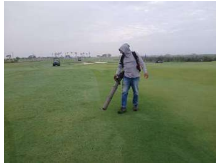
Actividad: Sopladora alrededor de greens Duración: 12, 13, 14, 15 y 16 de enero