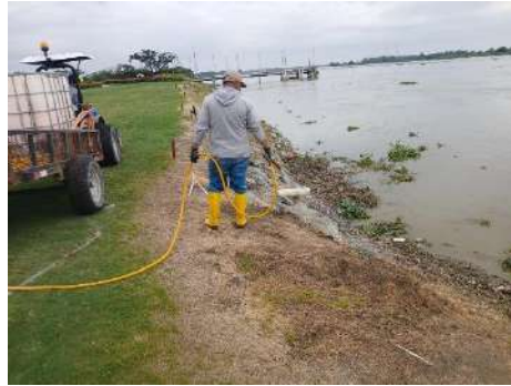
Actividad: Aplicación de control de maleza en orillado del hoyo 9 y 18 Duración: 21 de enero