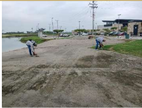
Actividad: Limpieza de vivero a lado del campo de practica Duración: 21 de enero