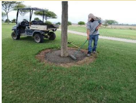
Actividad: Trabajos de nivelación en base de árboles Duración: 19 de enero