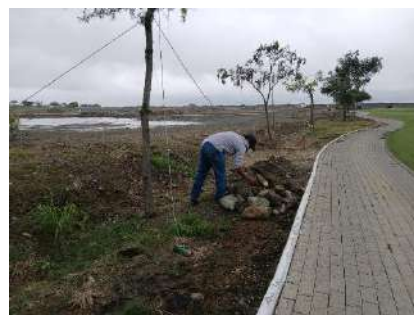
Actividad: Recolección de piedras para arreglo de talud del lago del hoyo 17 Duración: 15 y 16 de enero