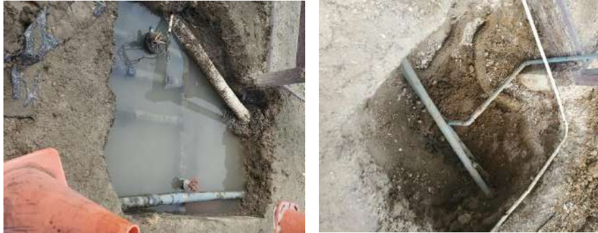
Actividad: Arreglo del sistema de riego en el área de Hípica Duración: 7, 8 y 9 de enero