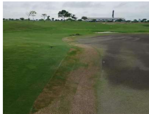
Actividad: Ampliación de greens Duración: 29 y 30 de enero